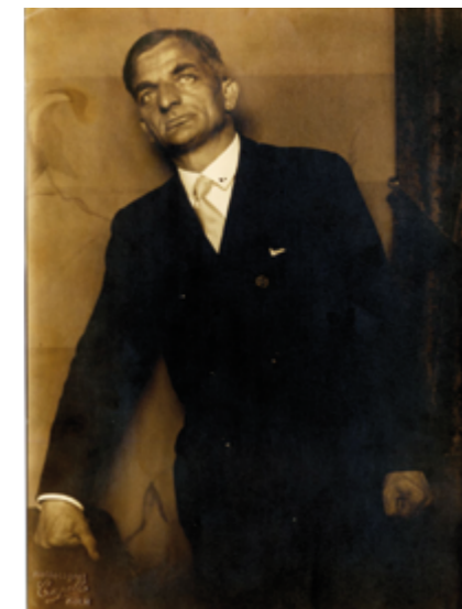
Joachim Ringelnatz (eigentlich: Hans Gustav Böttcher) 1883 - 1934