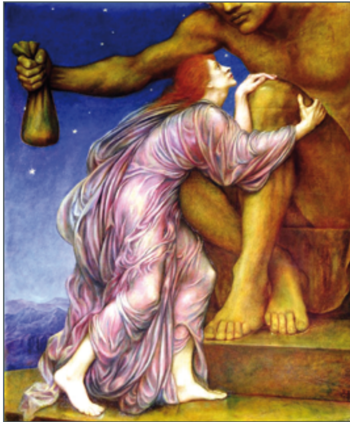
Evelyn de Morgan (1855-1919) „The worship of Mammon“

Freunde mit dem ungerechten Mammon“ (Lk 16,9) – jenes Wort von Jesus scheint da eher die Devise zu sein. Daran änderte auch die Reformation nur sehr bedingt etwas. Erst im Zuge der Säkularisierung wurden viele vormals kirchliche Ländereien enteignet. Daraus immer noch abgeleitete Zahlungen des Staates an die Kirche bringen die Kirche mit ihrem Geld auch heutzutage immer mal wieder in die Diskussion. Wenn ein katholischer Bischof seinen Amtssitz allzu luxuriös ausgestaltet, wirkt das auch auf das Bild der evangelischen Kirche negativ nach.