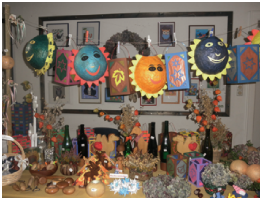
Herbstliche Dekorationen und eine Ahnung von Weihnachten.